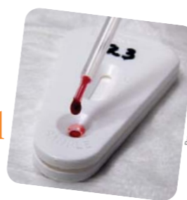
Programa Nacional DST e Aids

Para conhecer como as crianças de escolas públicas podem aprender mais e melhor, o UNICEF, em parceria com o Ministério da Educação, avaliou 33 escolas em cidades ou bairros pobres em todo o País. Cinco lições, comuns a todas essas escolas, foram identificadas, registradas e serão disseminadas para que as milhares de escolas públicas brasileiras possam garantir educação de qualidade a crianças que vivem em condições adversas, filhas de pais quase sempre com baixa escolaridade, crianças que, por exemplo, não têm livros em casa, mas descobrem nas salas de aula o gosto pela leitura