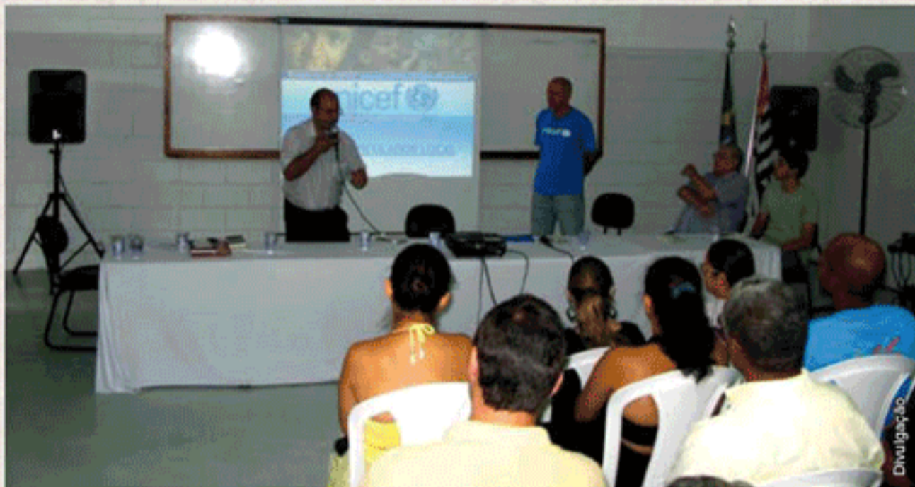
Comunidade reúne-se para formalizar a constituição do Grupo Articulador da Vila Progresso, na zona leste.

A Plataforma dos Centros Urbanos já conta com o apoio de várias universidades em São Paulo, que estão prontas tanto para atuar como parceiras nas atividades de mobilização e capacitação previstas pela Plataforma, quanto para fazer parte de Grupos Articuladores das comunidades.