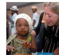
Marie-Pierre Poirier Representante do UNICEF no Brasil

Fundo das Nações Unidas para a Infância - SEPN 510 - Bloco A - 2º andar - 70750-521 - Brasília/DF Telefone: 0800 601 8407 - Fax: (61) 3340 8293 - futurocrianca@unicef.org