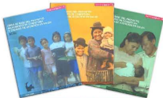
Documentos de la línea de base del Proyecto PRICCAS.

En el marco de la cooperación de UNICEF al gobierno de Bolivia, con el financiamiento del gobierno de Canadá, se ejecuta el Proyecto Incremento de Cobertura y Calidad de Atención en Salud (PRICCAS). El objetivo del proyecto es el de contribuir a que la población boliviana de los departamentos de Beni, Pando y Oruro mejoren su bienestar y cuenten con un sector salud fortalecido en su gestión, responsable, eficiente y equitativo; con servicios primarios particularmente los materno-infantiles de calidad y accesibles.