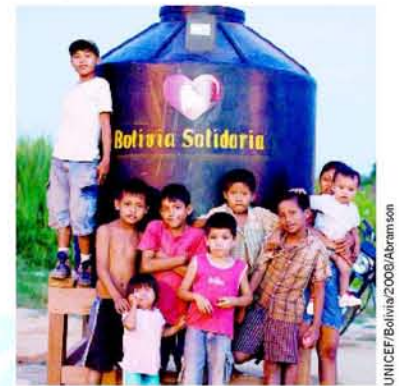
Entre las primeras acciones de respuesta que realizó UNICEF con los fondos de Bolivia Solidaria está la instalación de 35 tanques de agua de 3.500 litros en campamentos de Trinidad y Loreto.

El Embajador de Buena Voluntad de UNICEF, Ricardo Montaner, grabó un spot televisivo en Panamá con mensajes de sensibilización sobre las necesidades de los niños y niñas damnificados, con el fin de motivar a la población boliviana a donar dinero y fondos para la campaña Bolivia Solidaria. El spot fue ampliamente difundido hasta la conclusión de la campaña en los canales ATB, Red Uno y Bolivision.