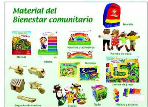
Contenido de la mochila de recuperación psicoafectiva.