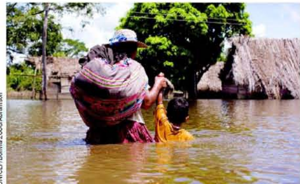
Las comunidades del Núcleo 38 del Municipio de San Julián en Santa Cruz, quedaron totalmente inundadas. En la foto una madre y su niño intentan llegar a su casa para recuperar algunas de sus pertenencias.

UNICEF accedió a los fondos CERF (Central Emergency Response Fund) de las Naciones Unidas para brindar asistencia humanitaria inmediata y oportuna. Asimismo, en respuesta al Flash Appeal solicitado por el Sistema de Naciones Unidas, junto a siete ONGs, obtuvo recursos provenientes de los gobiernos de Noruega, Suecia, Dinamarca e Italia.