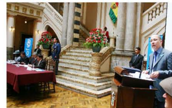
Gordon Jonathan Lewis, Representante de UNICEF, durante la presentación del Estado Mundial de la Infancia 2008 en Palacio de Gobierno.

"En Bolivia la mortalidad de menores de 5 años ha bajado de 131 por mil nacidos vivos en 1989, según datos de la ENDSA 2003, a 75