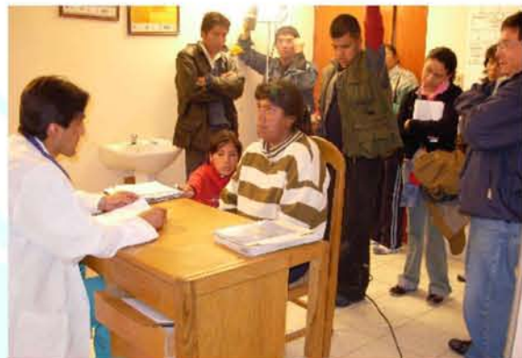
Estudiantes del Diplomado de Comunicación Estratégica en Salud Pública de Oruro, durante la filmación de un video sobre la importancia de la atención médica con calidad y calidez.

El Diplomado se desarrolló de manera semipresencial. Las clases magistrales fueron acompañadas de seguimiento y supervisión de proyectos y productos. El Diplomado iniciará sus actividades en Trinidad, Beni, Cobija y Pando, donde iniciaran las clases durante el segundo semestre de 2008.