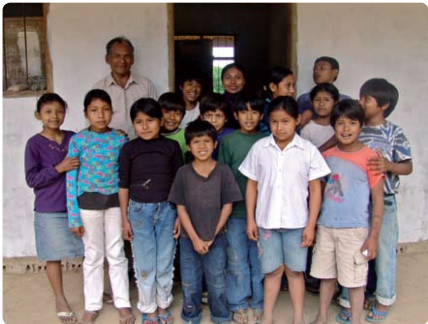
PROFESOR ORGULLOSO DE SU IDENTIDAD Y CULTURA MOJEÑA. ESTÁ AL SERVICIO DE LOS NIÑOS Y NIÑAS DE SU COMUNIDAD.

“Por esa marcha que tuvimos en el 90 hemos recuperado nuestro territorio y la dignidad de cada pueblo. Ahora me siento muy orgulloso por lo que hemos recuperado, no solamente la lengua nativa de San Ignacio sino de todo el país. Yo insto a mis alumnos a preservar nuestra cultura, recuperada con tanto esfuerzo y sacrificio”.