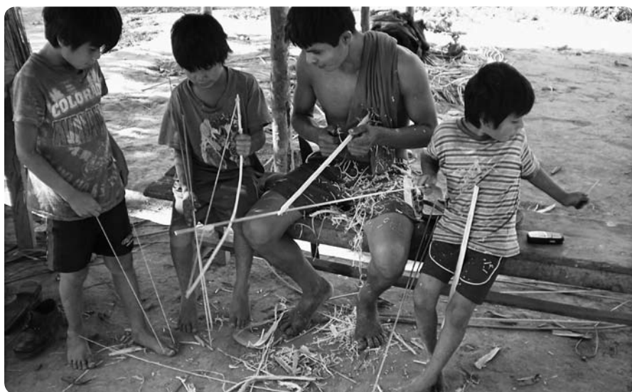
Nanaty enseñando a hacer flechas a los Miquity en comunidad

En Bolivia el Programa de Educación Intercultural Bilingüe - PROEIB Andes y la Universidad Mayor de San Simón de Cochabamba se hacen cargo del componente de investigación.