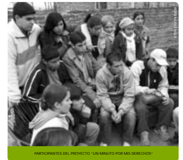
PARTICIPANTES DEL PROYECTO "UN MINUTO POR MIS DERECHOS"

Junto con el Centro Nueva Tierra y el Foro de Radios Comunitarias, se inició un proceso de formación y movilización con organizaciones sociales en las regiones del Nordeste, No-