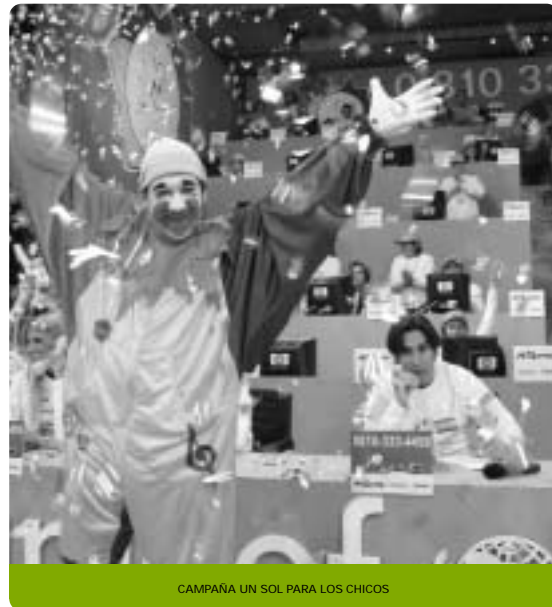
CAMPAÑA UN SOL PARA LOS CHICOS

Junto a la agencia de noticias Telam, se difundieron –a través de su servicio diario– noticias sobre la niñez y la adolescencia, de las cuales se han hecho eco 400 medios gráficos, radiales y televisivos de todo el país.