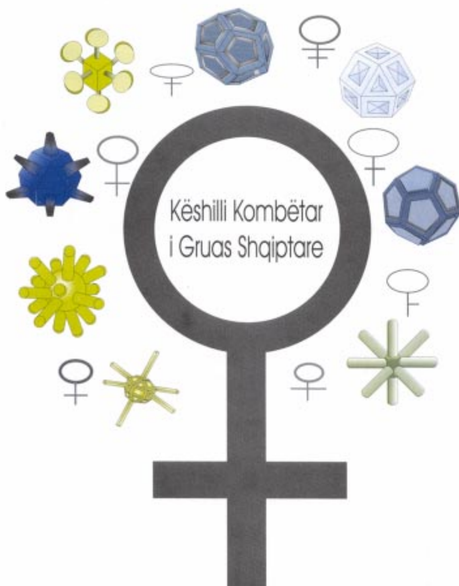
Skema 1 – Këshilli Kombëtar i Gruas Shqiptare