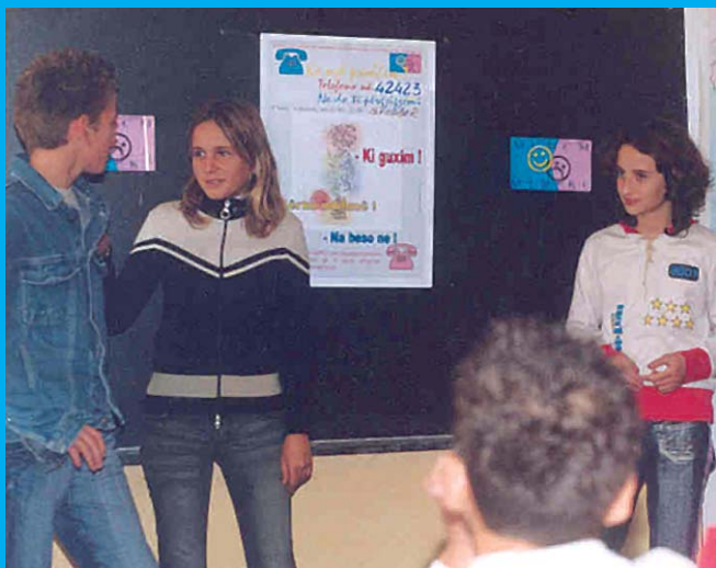
Nxenesit e shkolles "Skenderbej" ne Elbasan duke mesuar per zgjidhjen paqesore te konflikteve